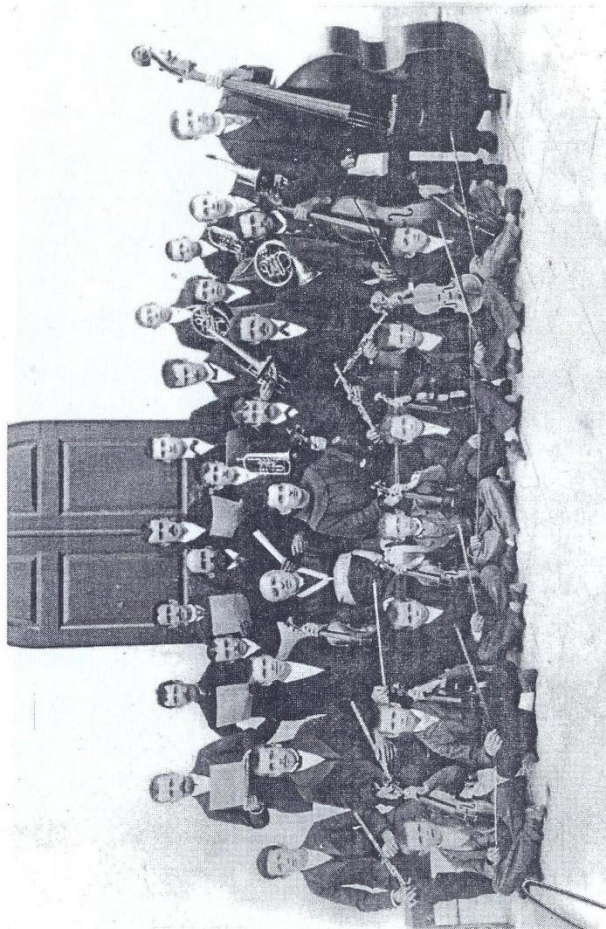
Hrvatsko pjevačko društvo 'Zvonimir' - Muo 27. VIII 1896.