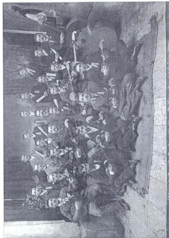
Hrvatski pjevački tamburaški zbor „Zvonimir“ iz Kotor, Hrvatska, 1903.

U Tivtu je bilo aktivno Hrvatsko tamburaško društvo „Antun Starčević“, osnovano 1906. godine.