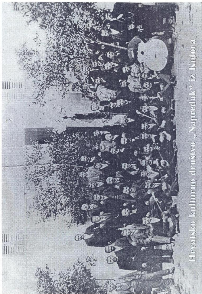
Hrvatsko kulturno društvo „Napredak“ iz Kotora